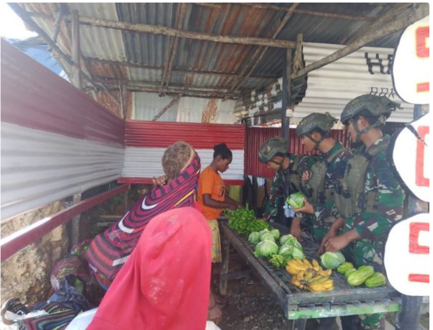
Foto: Satgas Yonif 509 Kostrad di Titik Kuat (Tk) Holomama Menggelar Kegiatan Borong Hasil Tani (Rosita) dengan Membeli Hasil Tani dari Mama Papua, Kamis (22/08/2024).

INTAN JAYA- Satgas Yonif 509 Kostrad di Titik Kuat (Tk) Holomama menggelar kegiatan Borong Hasil Tani (Rosita) dengan membeli hasil tani dari Mama Papua, Kamis (22/08/2024).