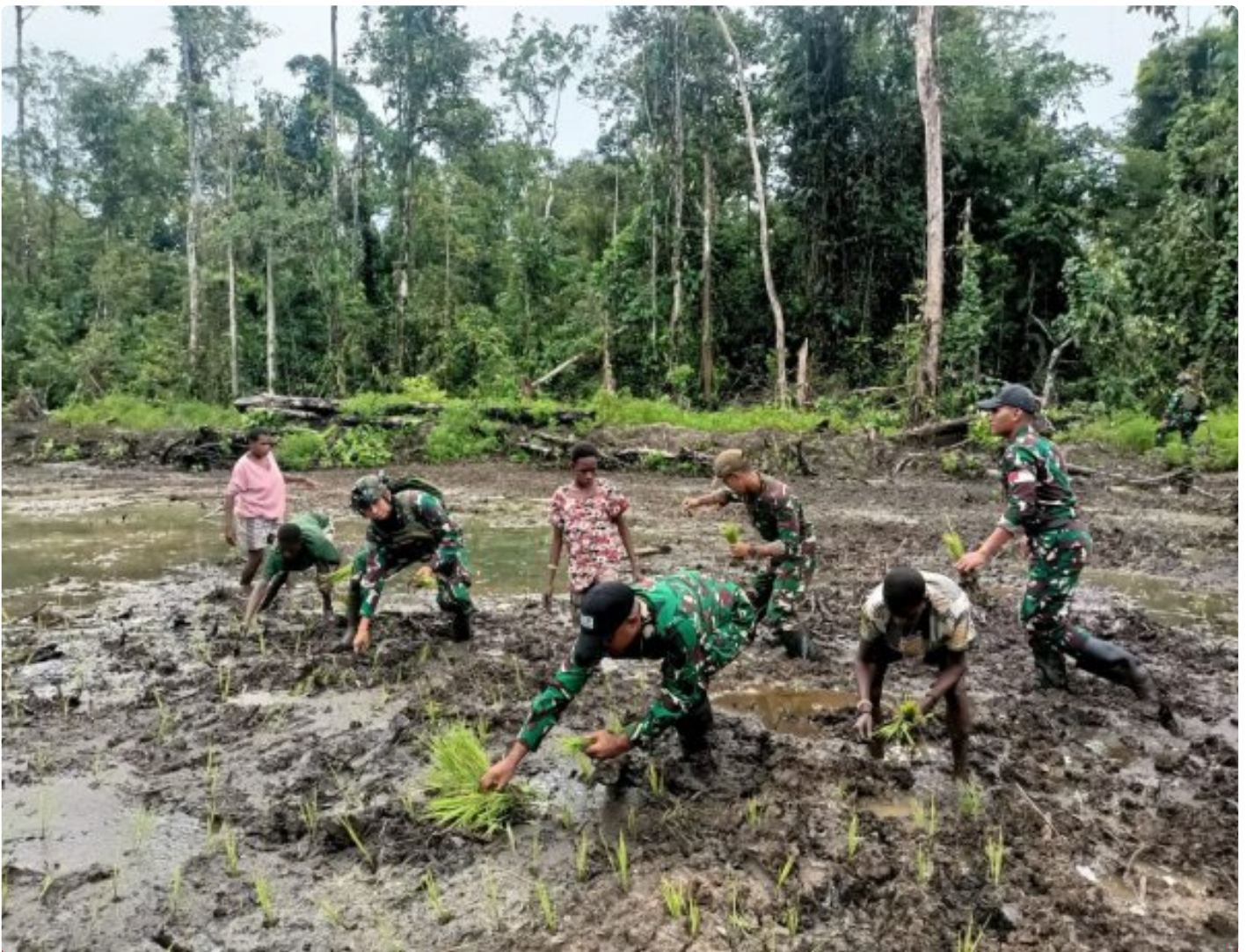
Foto: Satgas Pamtas Mobile RI-PNG Yonif 503/Mayangkara menggagas program ketahanan pangan yang melibatkan langsung warga Kampung Mumugu, Distrik Krepkuri, Kabupaten Nduga, Selasa (07/01/2025).

NDUGA- Dalam upaya membangun kesejahteraan masyarakat di wilayah penugasan Papua Pegunungan, Satgas Pamtas Mobile RI-PNG Yonif 503/Mayangkara menggagas program ketahanan pangan yang melibatkan