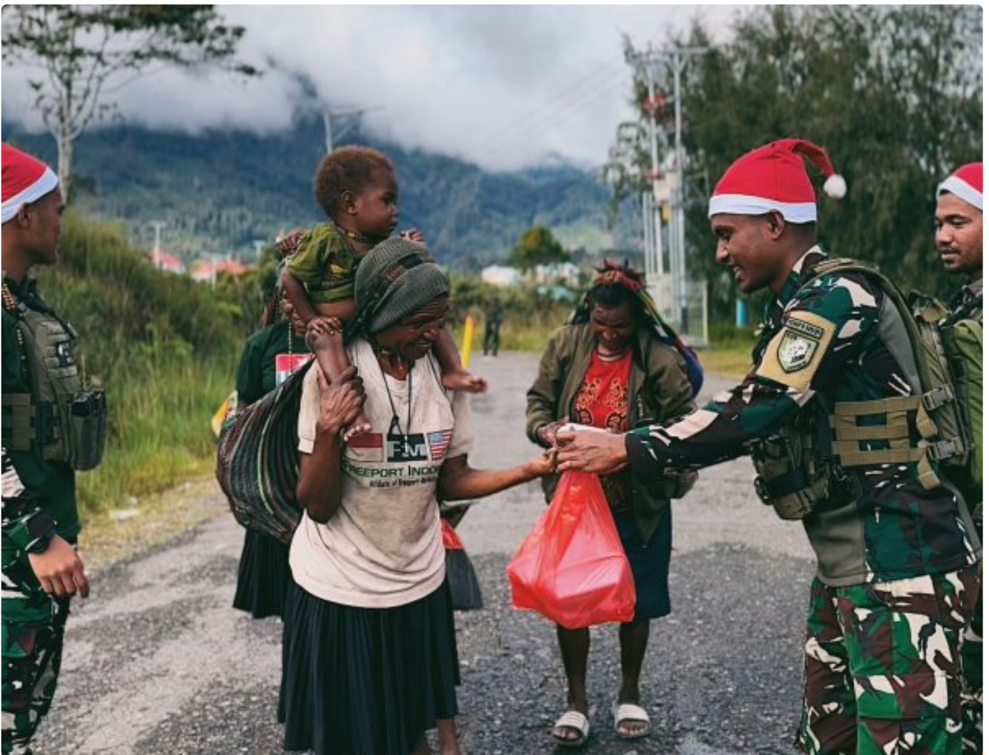
Foto: Satgas Yonif 509 Kostrad memberikan makna baru pada patroli keamanan dengan berbagi kebahagiaan bersama masyarakat di Intan Jaya, Papua.

PAPUA- Dalam balutan semangat Natal yang damai, Satgas Yonif 509 Kostrad memberikan makna baru pada patroli keamanan dengan berbagi kebahagiaan bersama masyarakat di Intan Jaya, Papua. Dipimpin oleh Pasiter Satgas, Lettu